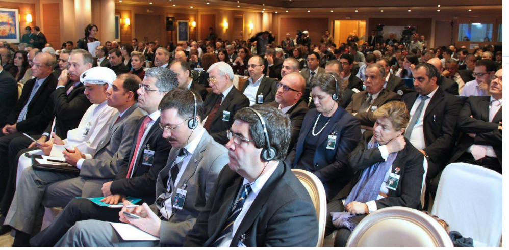
الحضور في الاجتماع السنوي الثالث للمنتدى العربي لحوكمة الإنترنت (بيروت، 26-27 تشرين الثاني/نوفمبر 2014)

والمسؤوليات ومتطلبات الاستضافة؛ (د) الإعداد اللوجستي والتنظيمي للاجتماع من قبل الجهة المضيفة.