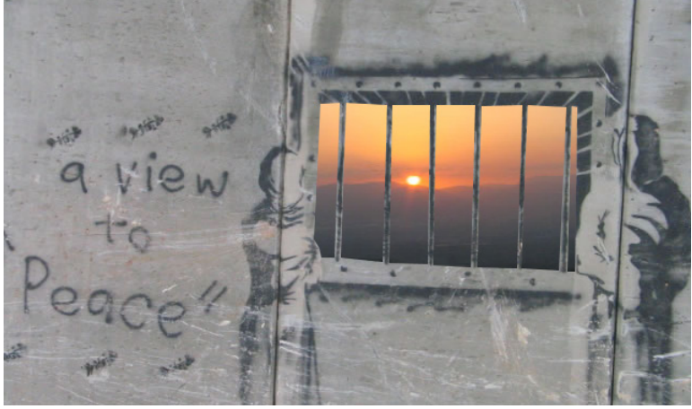
Ian Burt (CC BY 2.0)

المادة 76: "يحتجز الأشخاص المحميون المتهمون في البلد المحتل، ويقضون فيه عقوبتهم إذا أدينوا."