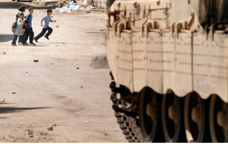
Pieter Stockmans (CC BY 2.0)