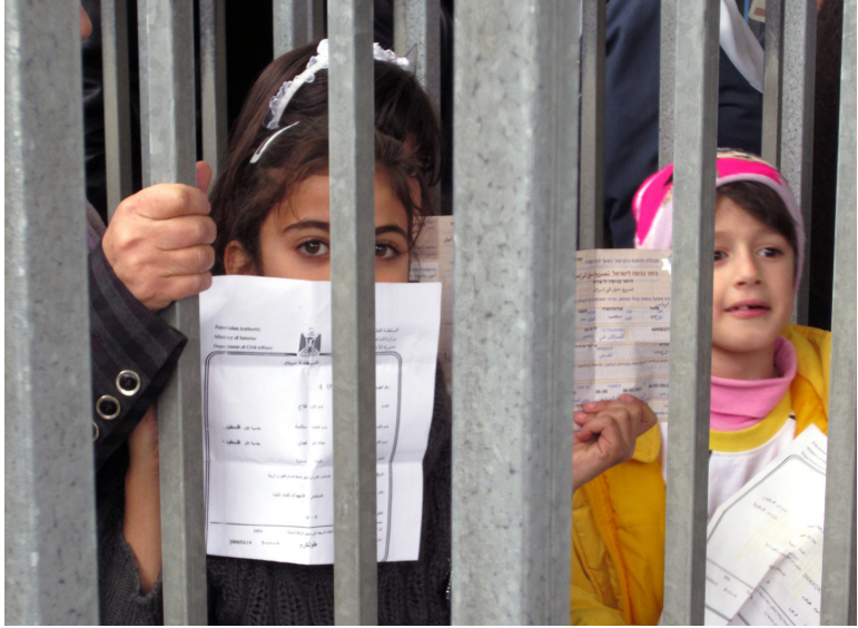
Scott Campbell (CC BY 2.0)