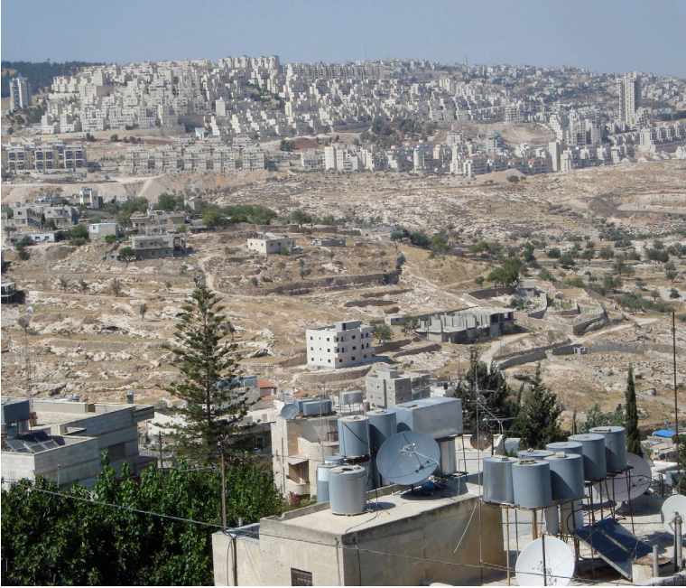
Pieter Stockmans (CC BY 2.0)