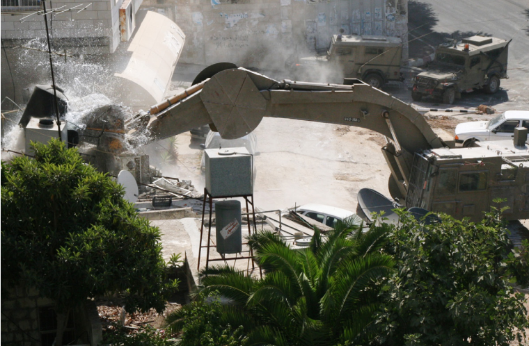
Michael Loadenthal (CC BY 2.0)

• في الفترة من كانون الثاني/يناير إلى تشرين الأول/أكتوبر 2013، هدمت السلطات الإسرائيلية 533 منزلاً ومرفقاً معيشياً فلسطينياً، منها 205 مجمعات سكنية؛