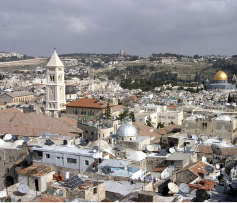
Justin McIntosh (CC BY 2.0)