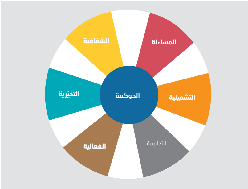
الشكل 1: أبعاد الحوكمة بناء على دراسات الإسكوا وخاصة تقرير مقومات الحكم في البلدان العربية 2014