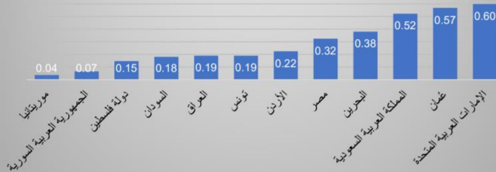
قيم المؤشر الإجمالية

https://www.unescwa.org/sites/www.unescwa.org/files/publications/files/government-electronic-mobile-services-gems-maturity-index-2019-arabic.pdf