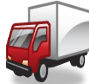
معدات النقل الأخرى