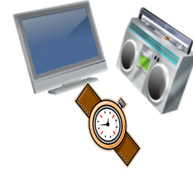
آلات ومعدات أخرى